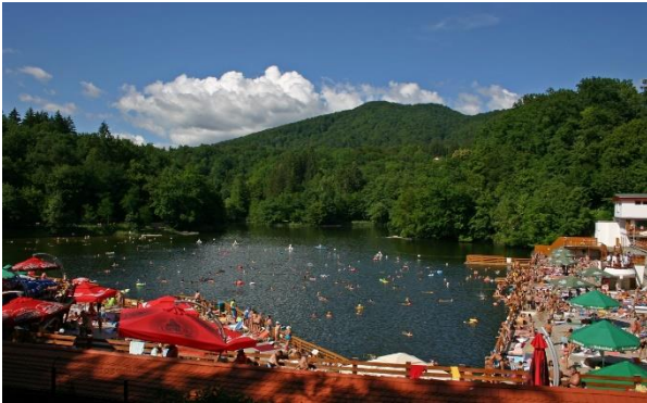
Szováta, séta a tó partján