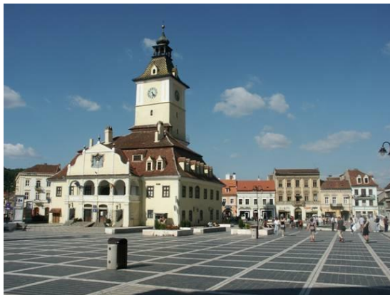
Brassó: Erdély legszebb városa