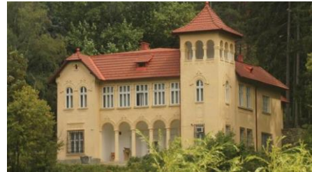
Boncza kastély, Csucs (Ady, Csinszka)

Út közben néhány rövidebb megálló erejéig nevezetességeket tekinthetünk meg: