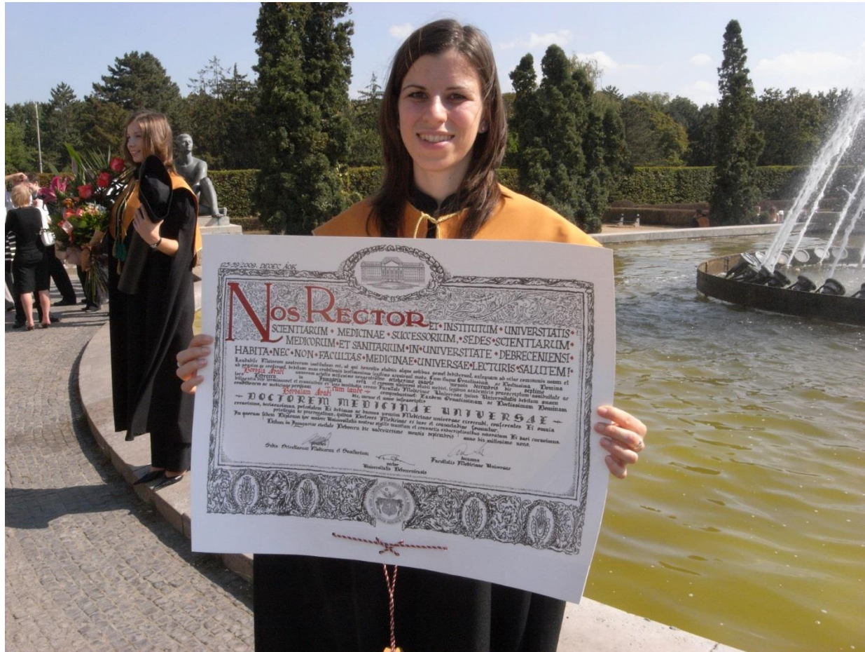
Bori orvos lett