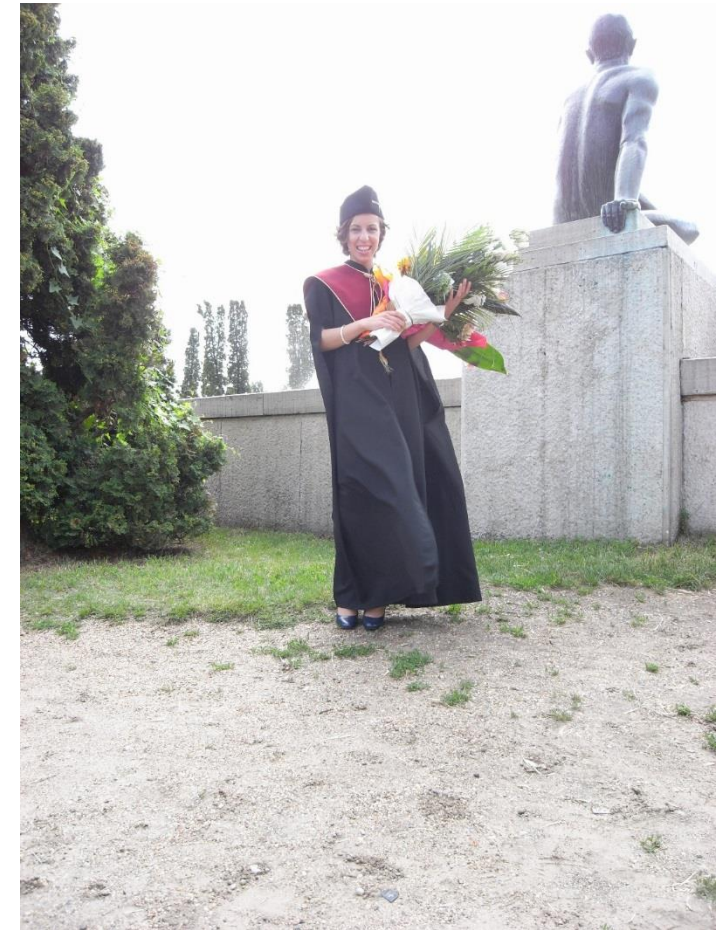
Detti matematikus lett