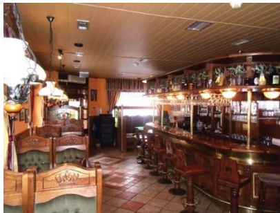
700 éves Prágai söröző meglátogatása