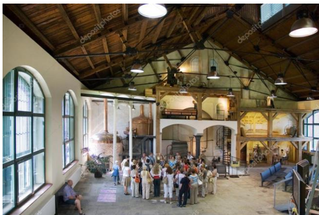
Pilsen sörgyár látogatása