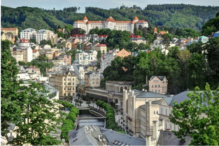
Karlsbad, magyar emlékek (Arany János)

Visszatérés Prágába, Óváros, zsidó negyed, vacsora