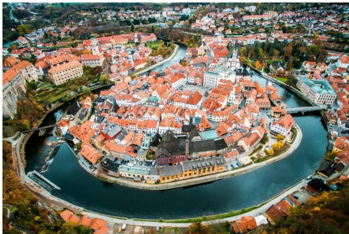
Cesky Krumlov vára